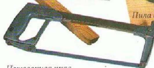
Пила для заготовки шпона